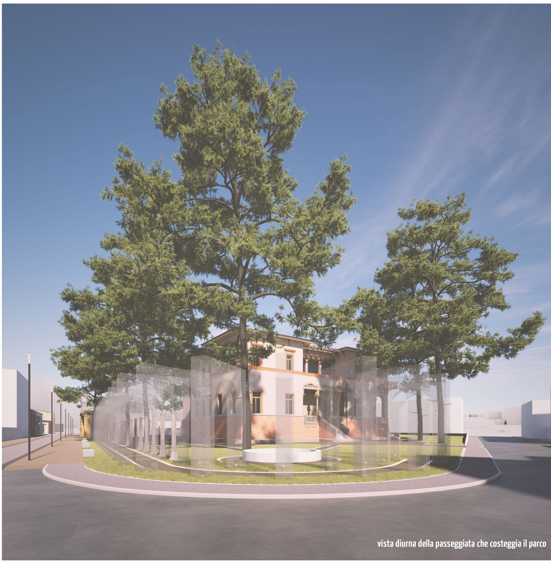
vista diurna della passeggiata che costeggia il parco