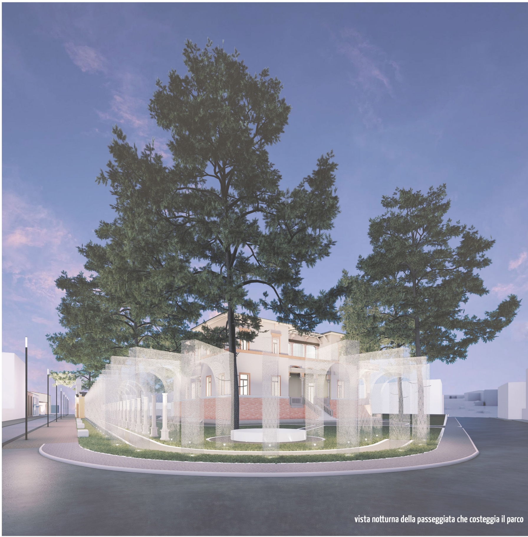
vista notturna della passeggiata che costeggia il parco